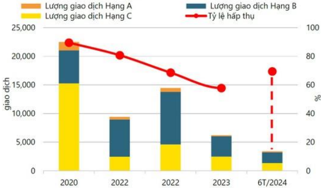
2024 年上半期のホーチミンマンション市場の動向

2024 年上半期の新規供給は 6,690 戸に達し、そのうち B クラスが 56%、C クラスが 40%、A クラスが 4%を占めています。新規供給は主に東部(トゥードゥック市)に集中し、57%、西部(ビンタイン区、ビンチャン区)に 29%の市場シェアを持っています。